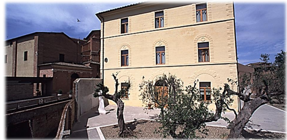
Università di Siena, Santa Chiara Lab

Tel: +39 0577233747 – E-mail: dfsa@unisi.it